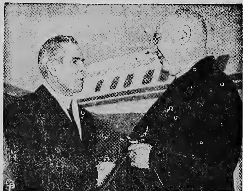
KARDINAAL SPELLMAN neemt afscheid van Bisschop Fulton J. Sheen voor zijn vertrek naar het Koreaanse front, waar hij de Kerstdagen met de troepen heeft doorgebracht. Het behoef geen betoog, dat de Amerikaanse militairen dit bezoek ten zeerste hebben gewaardeerd.